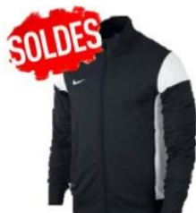
Veste survêtement 20.00€