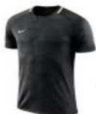
Maillot matchs 35.00€