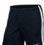
Short League 20.00€