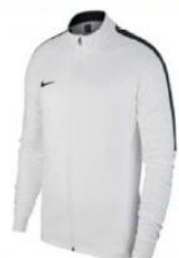
Veste survêtement 35.00€