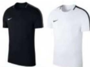
Maillot entraînements 20.00€