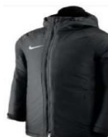
Parka Wint 120.00€