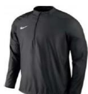
Veste coupe-vent 45.00€