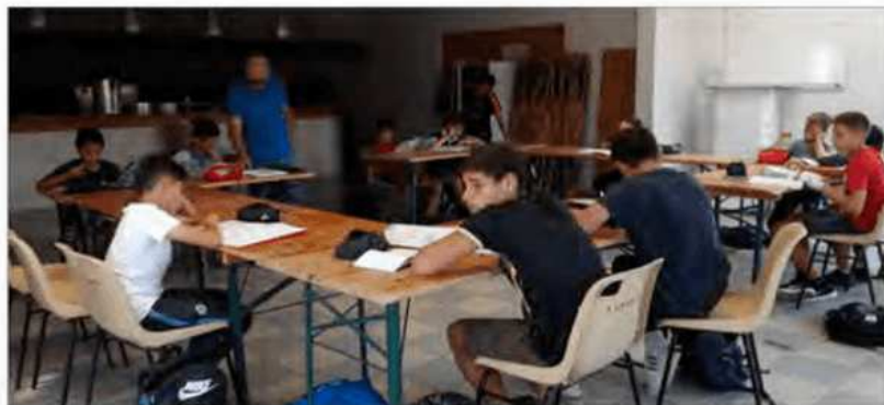
De l'accompagnement scolaire avant les entraînements.

En fin de saison dernière, le projet avait été porté aux parents des jeunes adhérents : l'idée, avant chaque entraînement, les collégiens pour la majorité, se retrouvent au