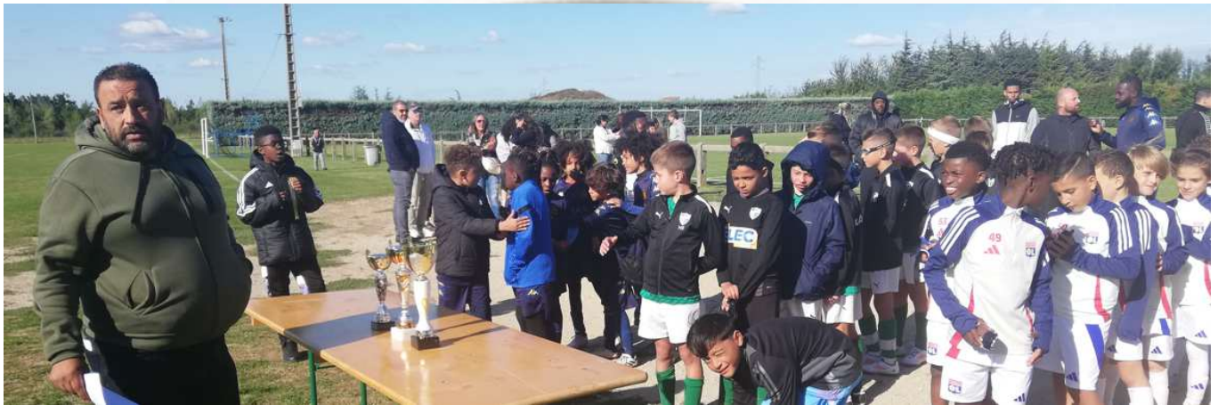
C'est l'Olympique Lyonnais qui s'impose en finale avec sa génération U10 face à St-André-le-Gaz.