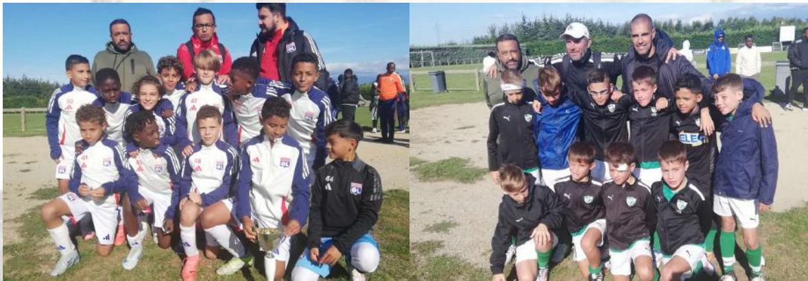
Très bon comportement de notre équipe.